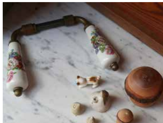
LINKS In huis heeft alles een verhaal

kwam hij hier terecht. Verder een oud bad, 'zonde om weg te gooien', daar zitten ze op een warme zomerdag graag in. Als de oude boom in blad zit ziet niemand hen, zelfs niet vanaf de sluis.