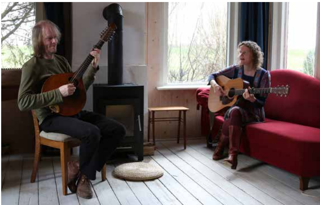
RECHTS In de huis- kamer wordt regelmatig muziek gemaakt